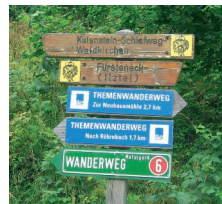
Keltendorf Gabreta in Ringelai